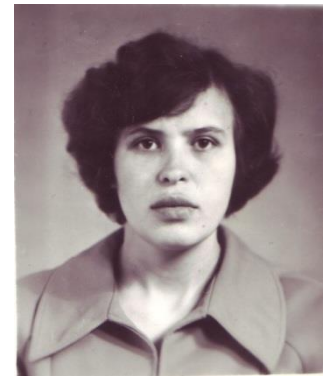
5 курс, БГПИ, 1981 г