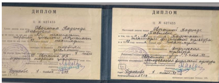
Диплом об окончании техникума физкультуры