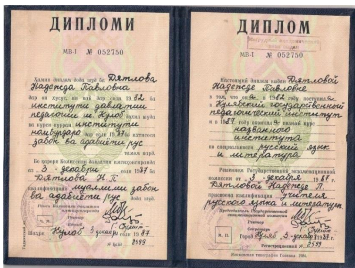
Диплом об окончании педагогического института

в достигнутом, она решает продолжить свою учительскую деятельность, и поступает в педагогический институт. В 1987 году закончила Кулябский Государственный педагогический институт.